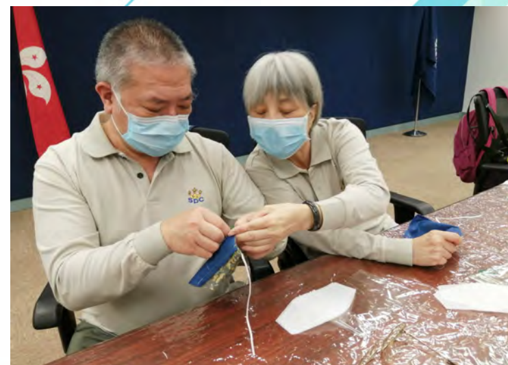
參與者中不乏恩愛夫妻拍擋，針指功夫互相指導。