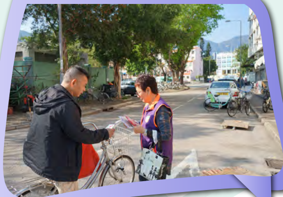
耆樂警訊會員向村民派發防罪單張。