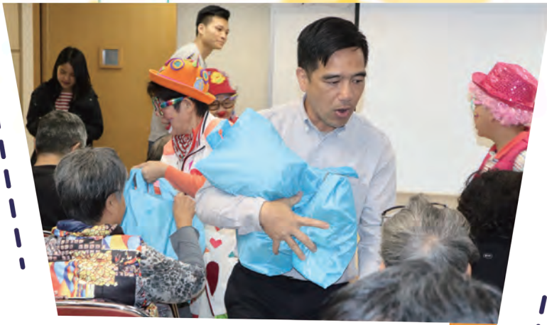
人員向長者派發會員親自編織的頸巾及新年禮物。

旺角警區警民關係組人員於二零二零年一月十四日舉辦「耆樂送暖到社區」活動，帶領耆樂警訊會員一行十多人浩浩蕩蕩，探訪康齡長者服務社日間服務中心的長者。活動除了探訪長者外，更送上由會員親自編織的頸巾及新年禮物，與他們分享減罪訊息，並安排了會員表演防騙小丑趣劇。當日一眾會員與長者們在活動中打成一片，活動尾聲時耆樂警訊會員祝福大家福壽安康，福樂綿綿，令大家都感受到警區對他們的關懷及溫暖。