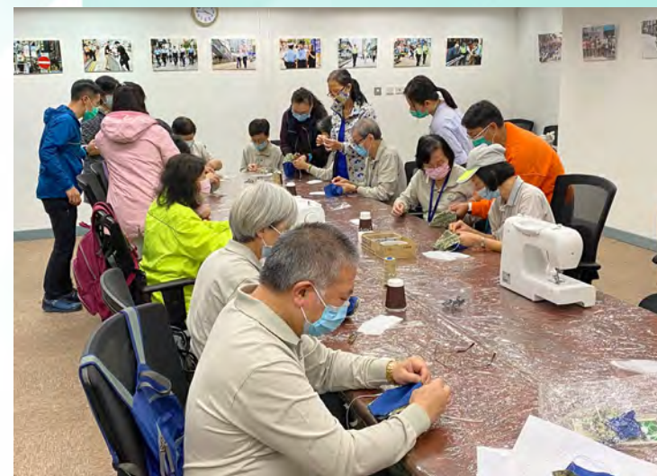
會員一針一線製作獨有的防護口罩。