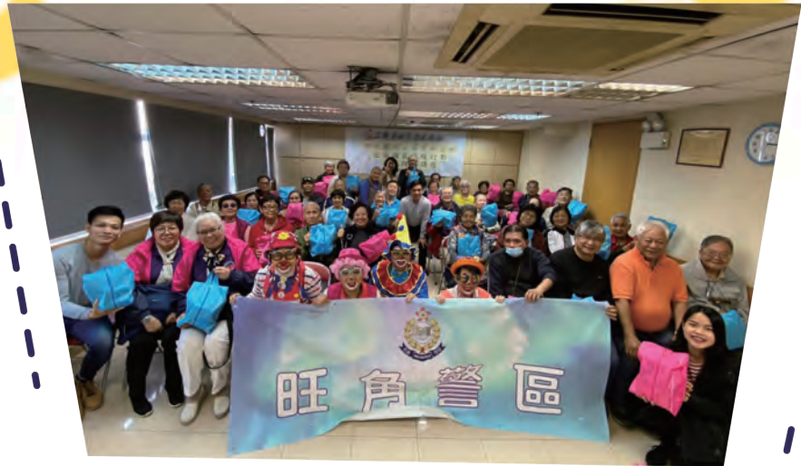
由會員表演防騙小丑趣劇深得長者喜愛。