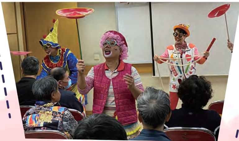
多才多藝的耆樂警訊會員扮演小丑雜技表現出色。