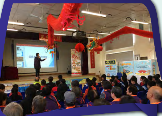
邊界警區警民關係組到學校向耆樂警訊會員及學生宣傳防騙信息。