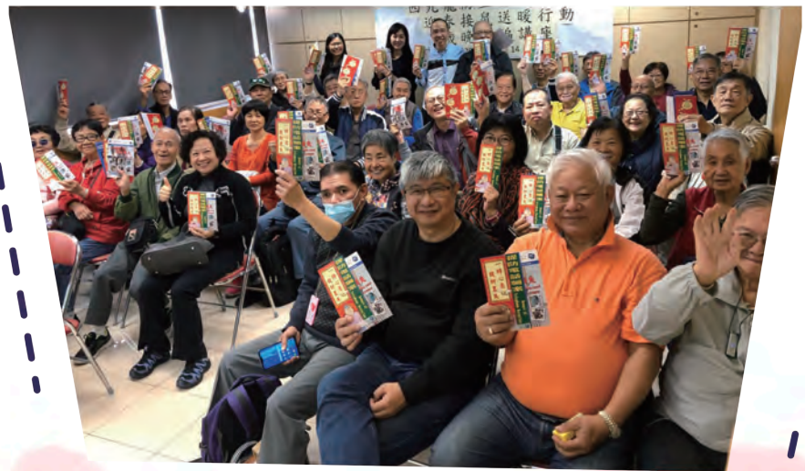
旺角警區送暖不忘宣傳防騙信息。