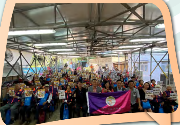
邊界警區人員向耆樂警訊會員及區內長者派發防罪宣傳單張。