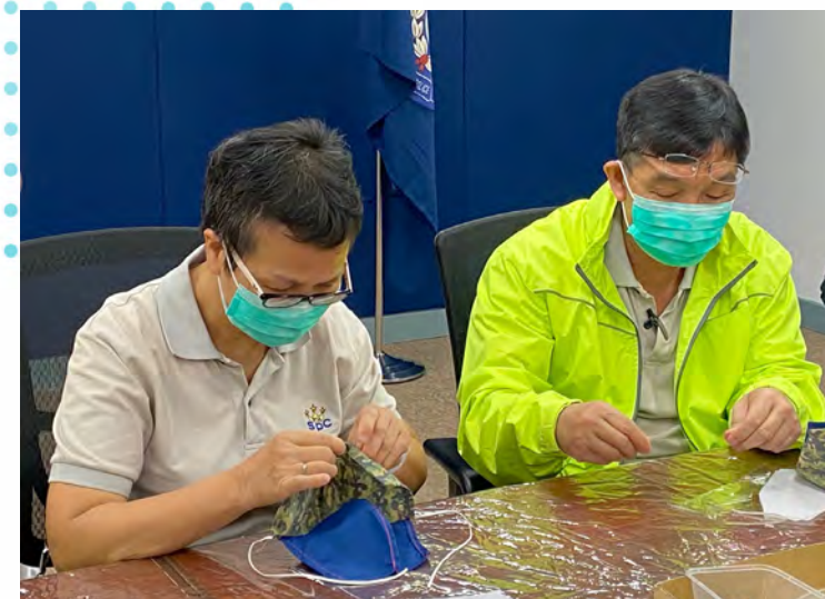
每個口罩都是會員精心縫製，獨一無二。