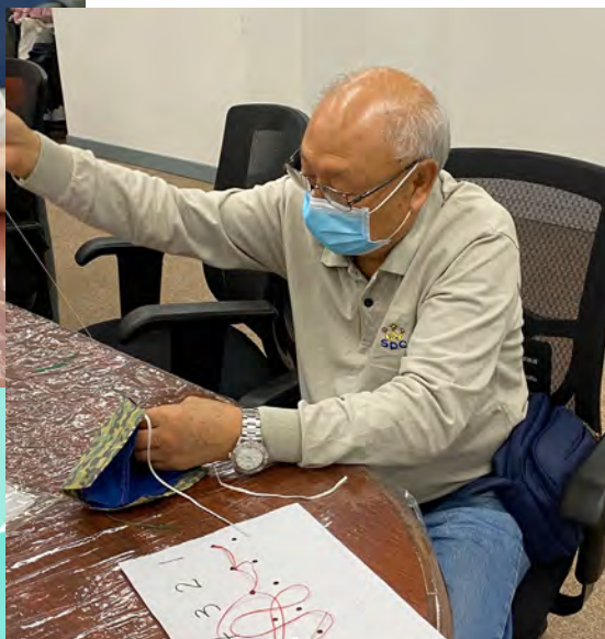
一針一線滿載耆樂警訊會員對社區的關愛。