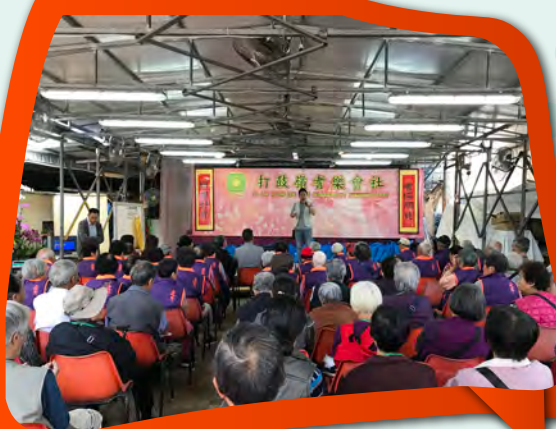
新界北總區防止罪案辦公室人員打鼓嶺耆樂會社向耆樂警訊會員及區內長者宣傳防騙資訊。