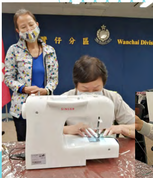
久違的車衣女工場面出現在灣仔警區，為區內有需要長者縫紉口罩。