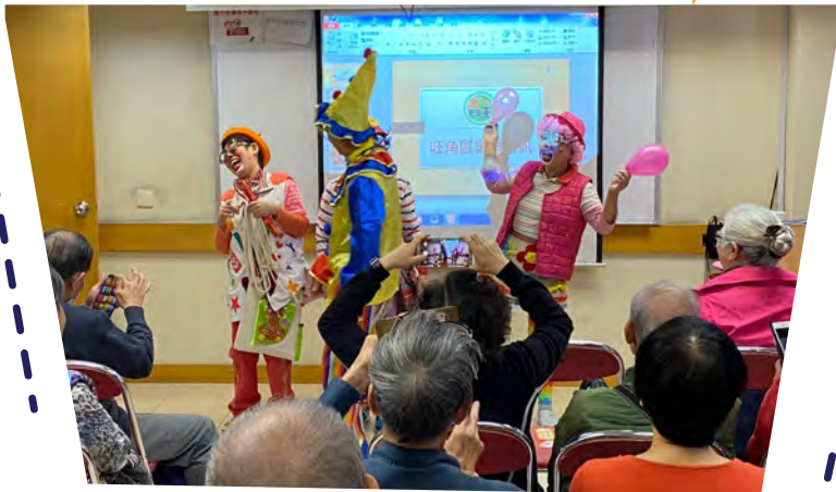
小丑表演防騙趣劇生鬼有趣，讓防騙信息更容易帶給長者。