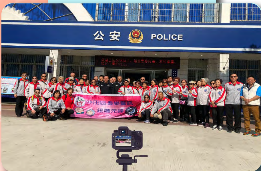
團友到訪清遠市公安局，參觀指揮中心110指揮大廳和清城分局光明派出所。