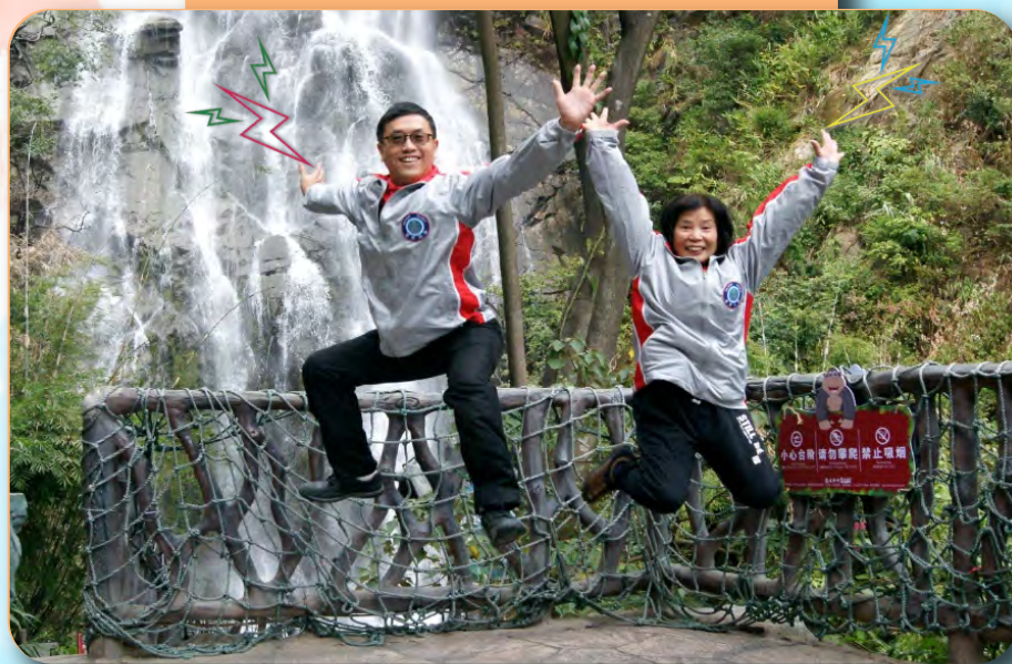
交流團行程豐富，團友興奮到跳起。