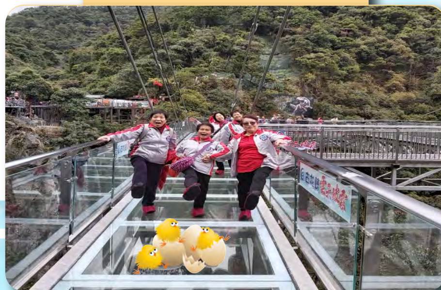
團友在玻璃橋上凌空漫步、驚險萬分。