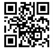
SPC Facebook Page