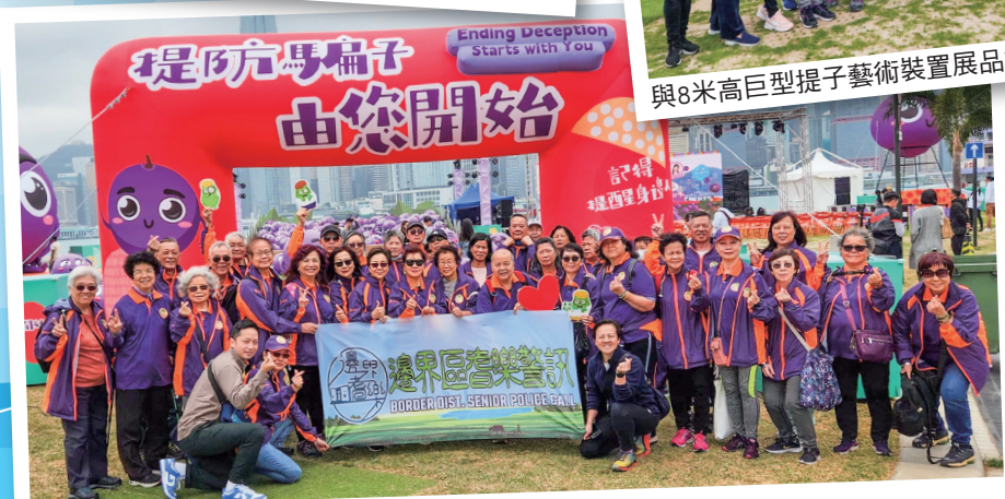
提子親子嘉年華 - 提防騙子·由您開始