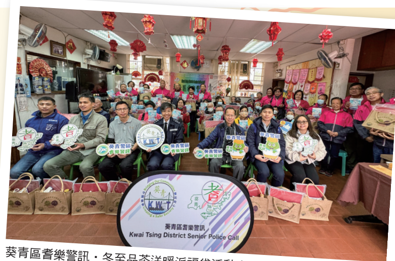
葵青區耆樂警訊・冬至品茶送暖派福袋活動大合照

其後，一眾嘉賓連同耆樂警訊會員上門探訪獨居長者，並向長者傳遞防罪訊息。每位長者都精神奕奕，並在家準備應節食物，大家都感受到冬至的氣氛，在充滿愛的活動中共度佳節。