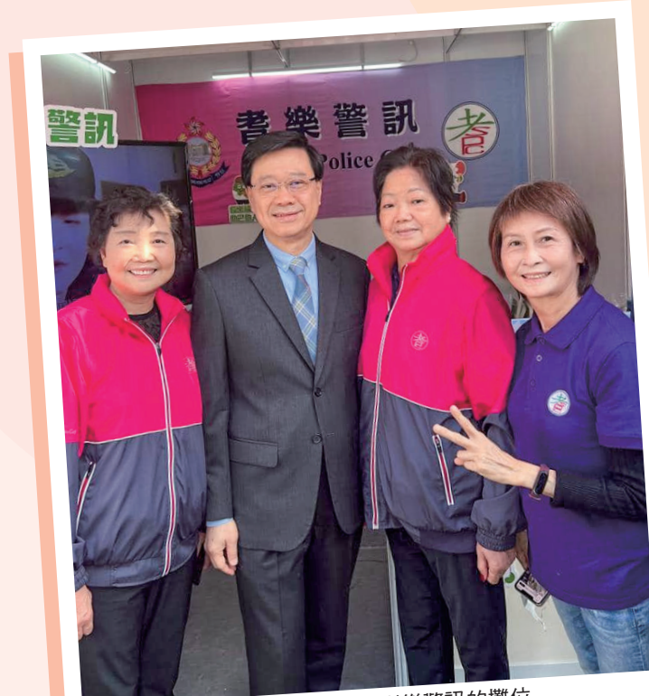
特首李家超先生(左二)親臨支持耆樂警訊的攤位

工作人員也邀請參觀耆樂警訊攤位的人士關注或讚好耆樂警訊的社交媒體平台，並安排二維碼讓參觀人士「一掃加入」成為耆樂警訊會員，四天的攤位活動共招募了109位新會員。