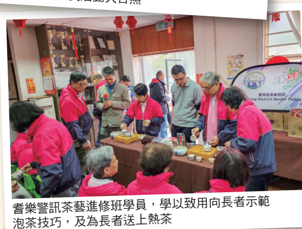
耆樂警訊茶藝進修班學員，學以致用向長者示範泡茶技巧，及為長者送上熱茶