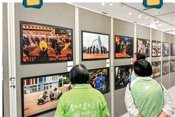
耆樂警訊會員欣賞相片