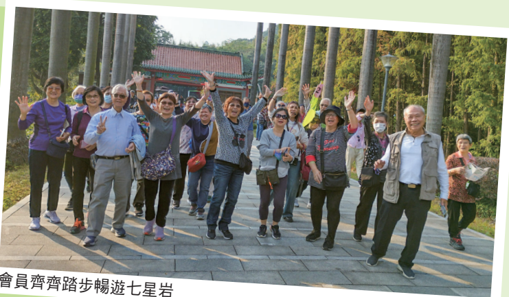
會員齊齊踏步暢遊七星岩