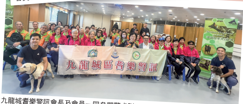
九龍城耆樂警訊會長及會員一同參觀警犬隊