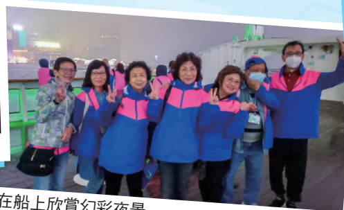
會員在船上欣賞幻彩夜景