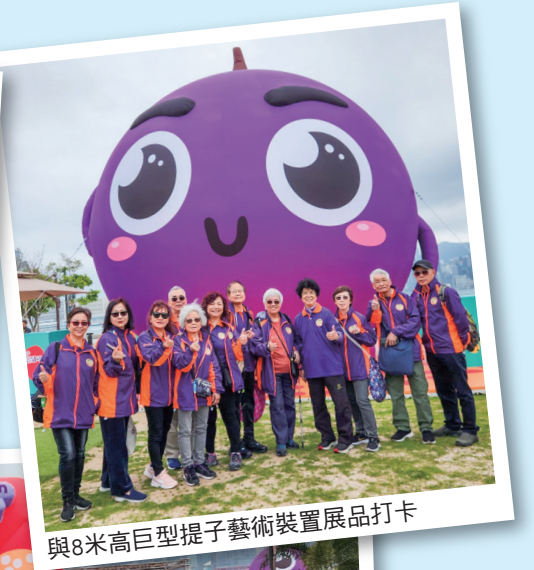
與8米高巨型提子藝術裝置展品打卡