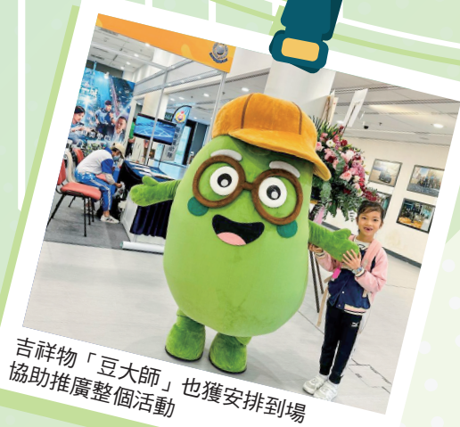
吉祥物「豆大師」也獲安排到場協助推廣整個活動