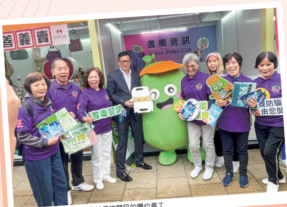
保安局局長鄧炳強(左四)支持耆樂警訊的攤位義工