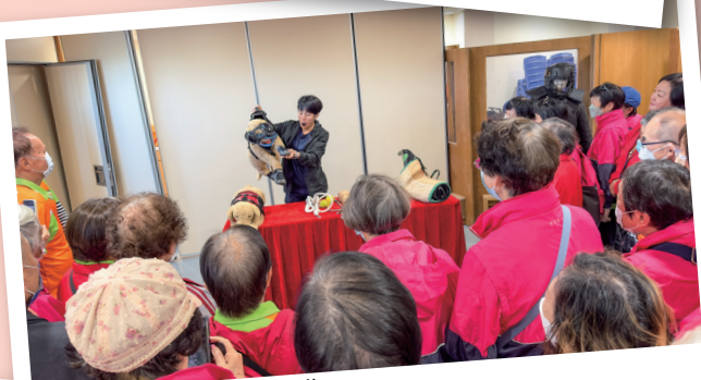
會員了解不同警犬的裝備