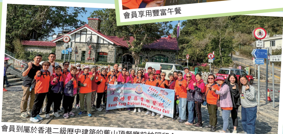
會員到屬於香港二級歷史建築的舊山頂餐廳前拍照留念