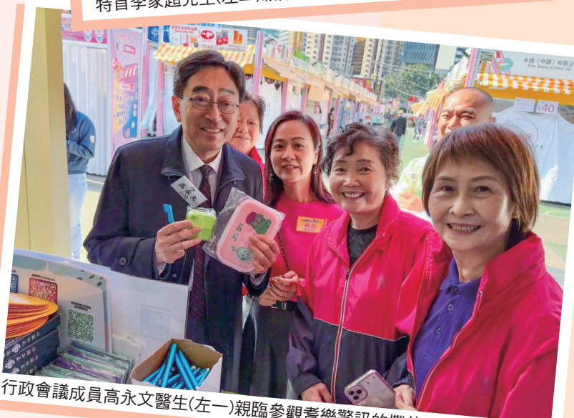
行政會議成員高永文醫生(左一)親臨參觀耆樂警訊的攤位