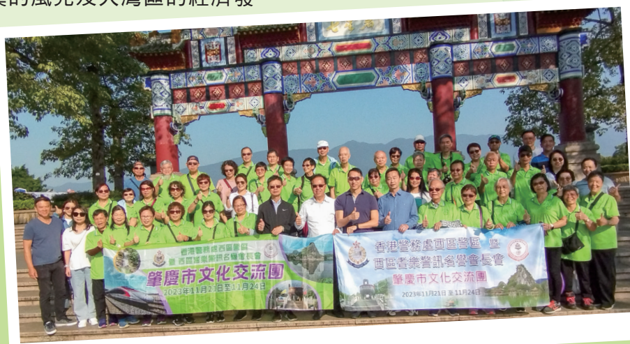
七星岩牌坊大合照