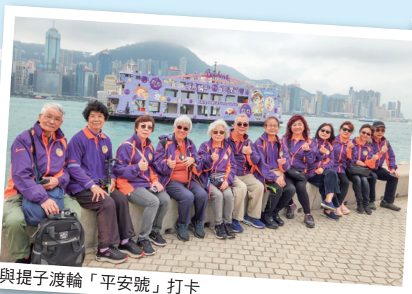
與提子渡輪「平安號」打卡

會員們還參與了「提子與我·提防騙子」兒童故事時間，欣賞由香港警務處發佈的最新幼兒提子繪本書籍，透過親子閱讀，家長與小朋友共同培養防騙意識。邊界警區警民關係組人員藉此機會向會員們介紹如何使用手機下載警方的「防騙視伏器」，並介紹更新版本的三個新功能：包括「可疑來電顯示」、「可疑網站偵測」及「公眾舉報平台」。活動後會員們都樂而忘返，並贏取多款限量版提子紀念品。活動除了加強會員的防騙意識外，他們也可以再把有關訊息連同紀念品送給親友，讓更多人得到防騙資訊，以免受騙。