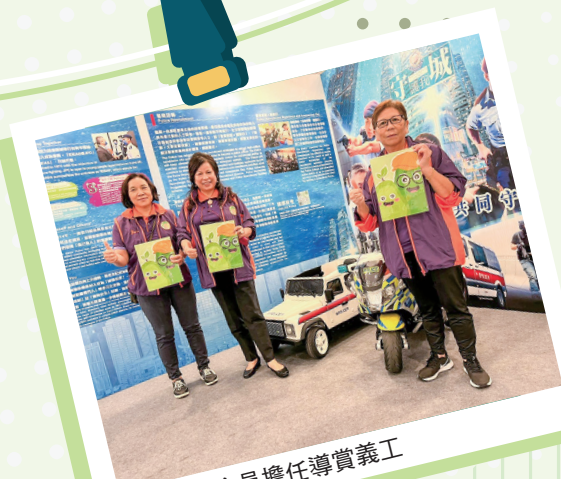
耆樂警訊會員擔任導賞義工