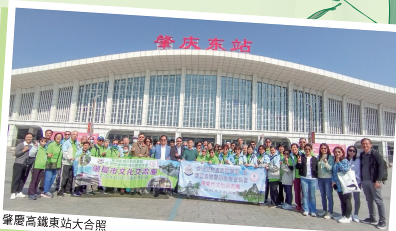
肇慶高鐵路東站大合照

肇慶旅遊文化資源方面非常豐富，例如有鼎湖山、七星巖、羅鍋古村、硯洲島、硯石文化村、悅城龍母廟、古宋城牆及閱江樓等等。交通網絡方面，肇慶除了城軌、高鐵等及國際機場也快將落成，交通將更四通八達。