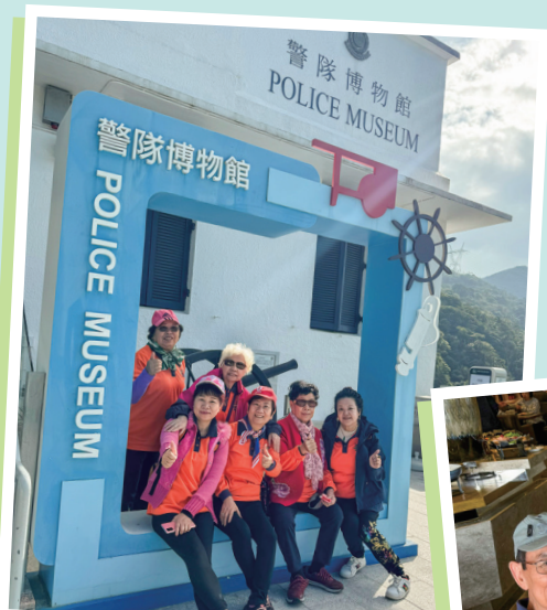
會員參觀警隊博物館

觀塘區耆樂警訊透過這次一天遊，讓會員可以輕鬆出外走走，心曠神怡。藉着參觀警隊博物館，讓大家認識香港警隊的歷史和發展。更透過參觀海防博物館，令大家深深感受到中國人民艱苦抗戰的經歷，為大家增添多一份愛國情懷，對國家更有歸屬感。