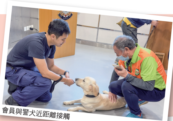
會員與警犬近距離接觸

參觀後，會員除了更加了解警犬隊的工作外，同時也深明每隻警犬都為香港治安、保護市民生命及財產擔任一個重要角色。