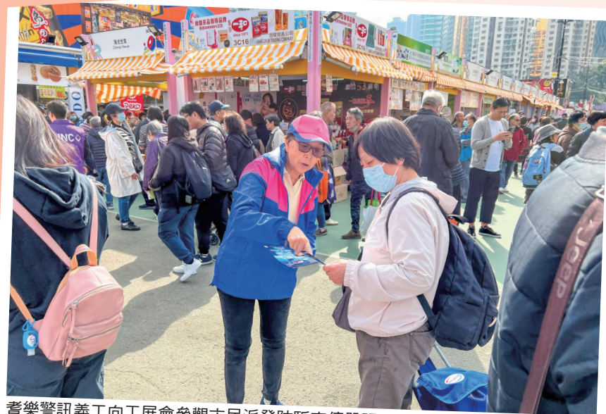
耆樂警訊義工向工展會參觀市民派發防騙宣傳單張