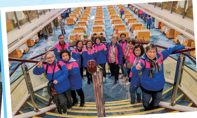
晚餐後在船上參觀及拍照留念