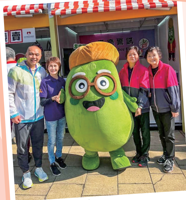
一眾會員與豆大師合照