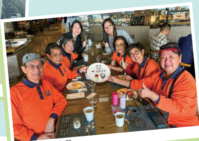
會員享用豐富午餐