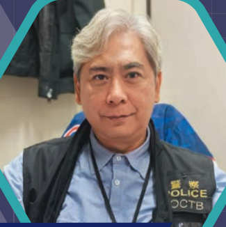
警署警長 (有組織罪案及三合會調查科) 歐陽傑