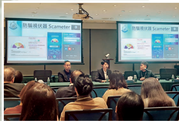
▲June在防騙講座中向市民介紹「防騙視伏器」。