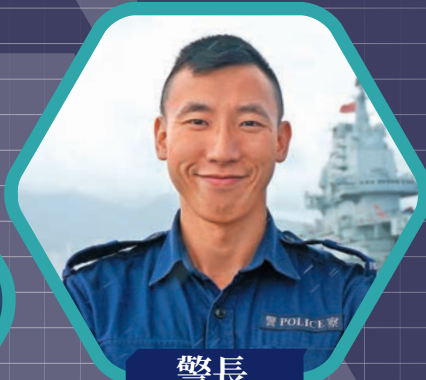
警長 (水警港外警區) 薛鳴濤