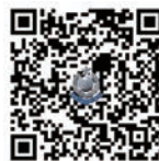
警聲特刊 《不同職級崗位· 由初哥到一哥 香港警察守城故事》