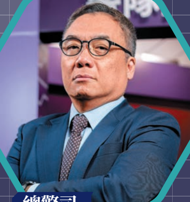
總警司 (國家安全處) 李桂華