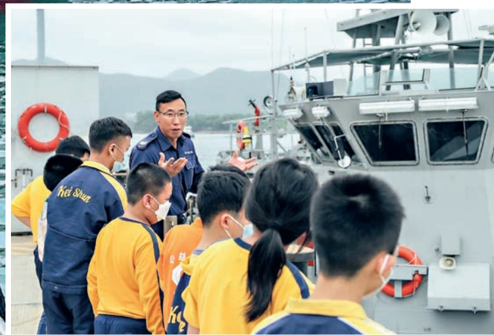
▲阿濤除了在海面執法，亦會向學生們講解水警的工作和警輪上的設備。