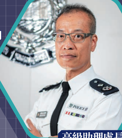
高級助理處長 (刑事及保安處) 葉雲龍