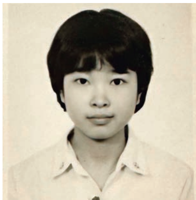
▲阿貞於1990年投考文書助理時的照片。

由藍領變成白領，最大分別是什麼？阿貞一臉感恩回答：「完全是兩回事！加入警隊之後，突然開竅，先在夜校重讀，再戰會考，終於獲得一張像樣的成績單。警隊也提供很多課程給我們選擇，我修讀了電腦和普通話等，也在校外進修，學習翻譯，彷彿要把以前沒有讀的書，一步一步讀回來。回想起來，如果沒有加入警隊，我怎可能可以一邊工作賺取入息，一邊進修增值自己？在這裏不單找到人生方向，踏實工作；也找到終身伴侶，組織家庭。我丈夫也是警隊的文職同事。」一個決定，的確可以改變一生。