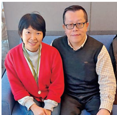
▲阿貞與同樣是擔任警隊文職的丈夫。

目前阿貞在策劃及發展部工作，之前有沒有服務過其他部門？「入職時我被派去宿舍部，負責同事的房舍福利、供樓津貼等事宜。不久調去人事部，處理同事的病假、工傷假等，如果涉及工傷賠償，同事對賠償金額有異議，需要提請訴訟，我們也會跟進到底。後來再到財務部，負責退休金計算。這段時間因工作關係，與警察有更多接觸，深切體會到他們的不容易。於我而言，希望在我負責的範疇裏，盡力提供協助，讓他們免卻後顧之憂。前前後後加入過幾個單位，直至晉升為文書主任後，才被調到策劃及發展部，服務至今。」